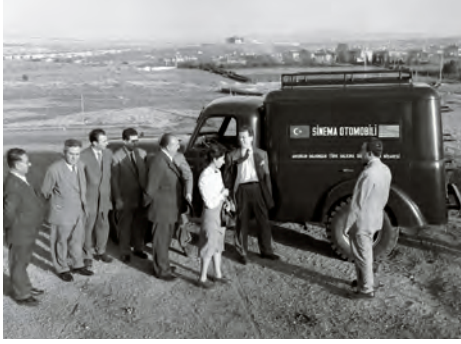
Amerikan Haberler Merkezi'nin gezici sinema otolarının Öğretici Filmler Merkezi'ne devri töreni. Handover ceremony for the traveling movie cars of the American News Center to Educational Films Center. 1953, Amer Haber Merkezi, Amer News Center